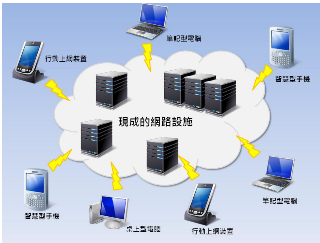
圖一 雲端運算概念圖 (作者自行繪製)

網路溝通多台裝置的運算工作，或是透過網路連線取得由遠端主機提供的服務等，都可以算是一種「雲端運算」(楊錦生，2009)(參見圖一)。換言之，「雲端運算」可以說是另一種「網路運算」形態。